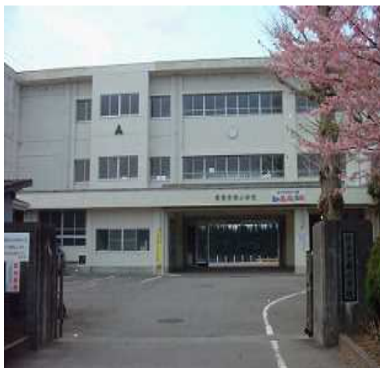
伊豆市立修善寺南小学校