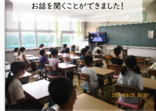
教室ではとても静かにお話を聞くことができました!