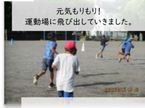
元気もりもり! 運動場に飛び出していました。

たくさんの荷物を抱えながらも、みんな元気に登校してきました。久しぶりの友達とのおしゃべりも弾んでいたようです!