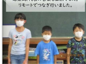
始業式、代表の言葉も立派でした。リモートでつなぎ行いました。