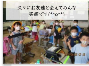
久々にお友達と会えてみんな 笑顔です(*^o^*)