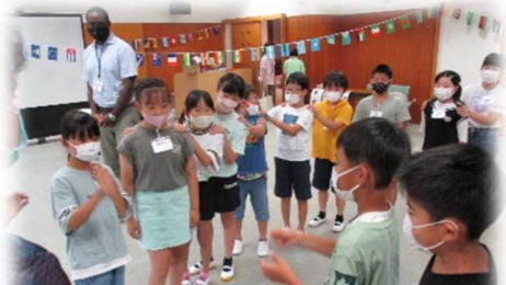
「英語」ではゲームを通して英語を学び『ALL ENGLISH』での活動を楽しむ姿が見られました。

「ジオ教室」に参加した子供たちは、目を輝かせながら実験を通して伊豆半島のつくりを学びました。