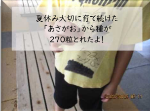
夏休み大切に育て続けた「あさがお」から種が270粒とれたよ!

たくさんの荷物を抱えながらも、みんな元気に登校してきました。久しぶりの友達とのおしゃべりも弾んでいたようです!