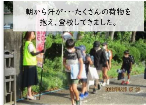
朝から汗が...たくさんの荷物を 抱え、登校してきました。