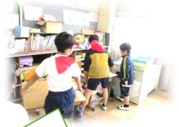
机は重いから6年生が運ぶよ

南小の自慢の一つ「黙働清掃」が今年度も縦割りのメンバーでスタートしました。慣れない1年生に対して丁寧に教える上級生の姿、教えてもらったことを一生懸命頑張る1年生の姿、自分から気付いて動く南っ子の姿…この1年も黙働清掃は南っ子に任せて大丈夫だと確信しました。掃除をとおして、思いやりの心、感謝の気持ち、集団生活の意味など多くの事を学んでいくと思います。