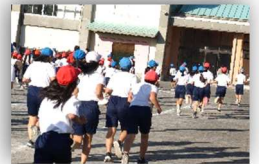
朝運動頑張っています!